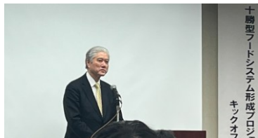
北海道国立大学機構・長谷山彰理理事長